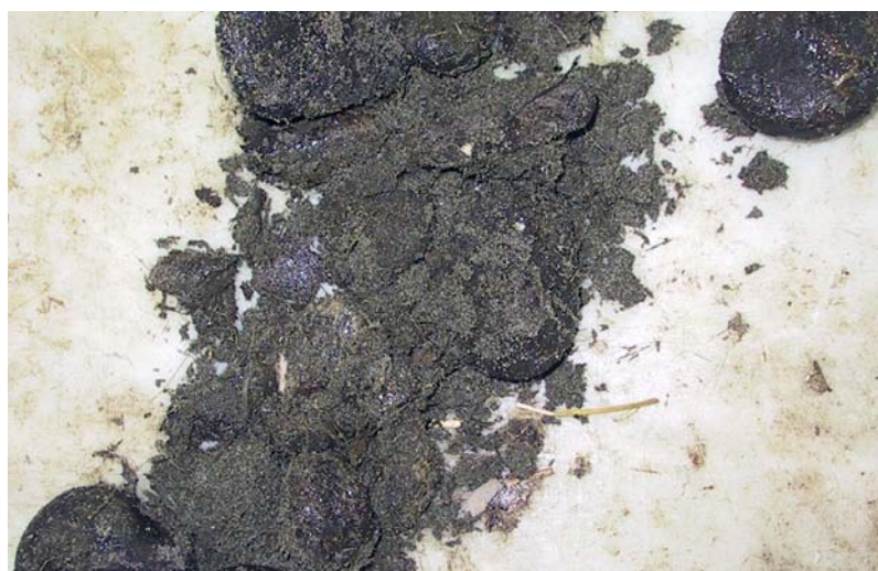
Als je de mestballen van je paard even uit elkaar gooit, zie je het zand al zitten.

In een handschoen test je zelf eenvoudig of er zand in de mest zit